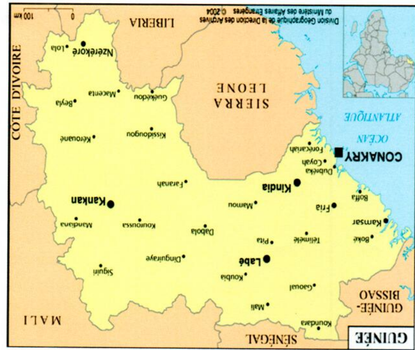
Fig. 1 : Carte de la Guinée